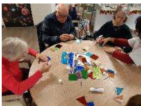
Atelier fabrication de couronnes des rois