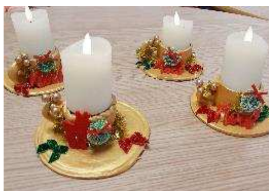
Atelier créatif : déco de Noël