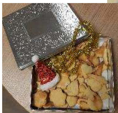
Atelier cuisine : Biscuit de Noël