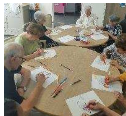
Activité manuelle sur le thème de l'automne.